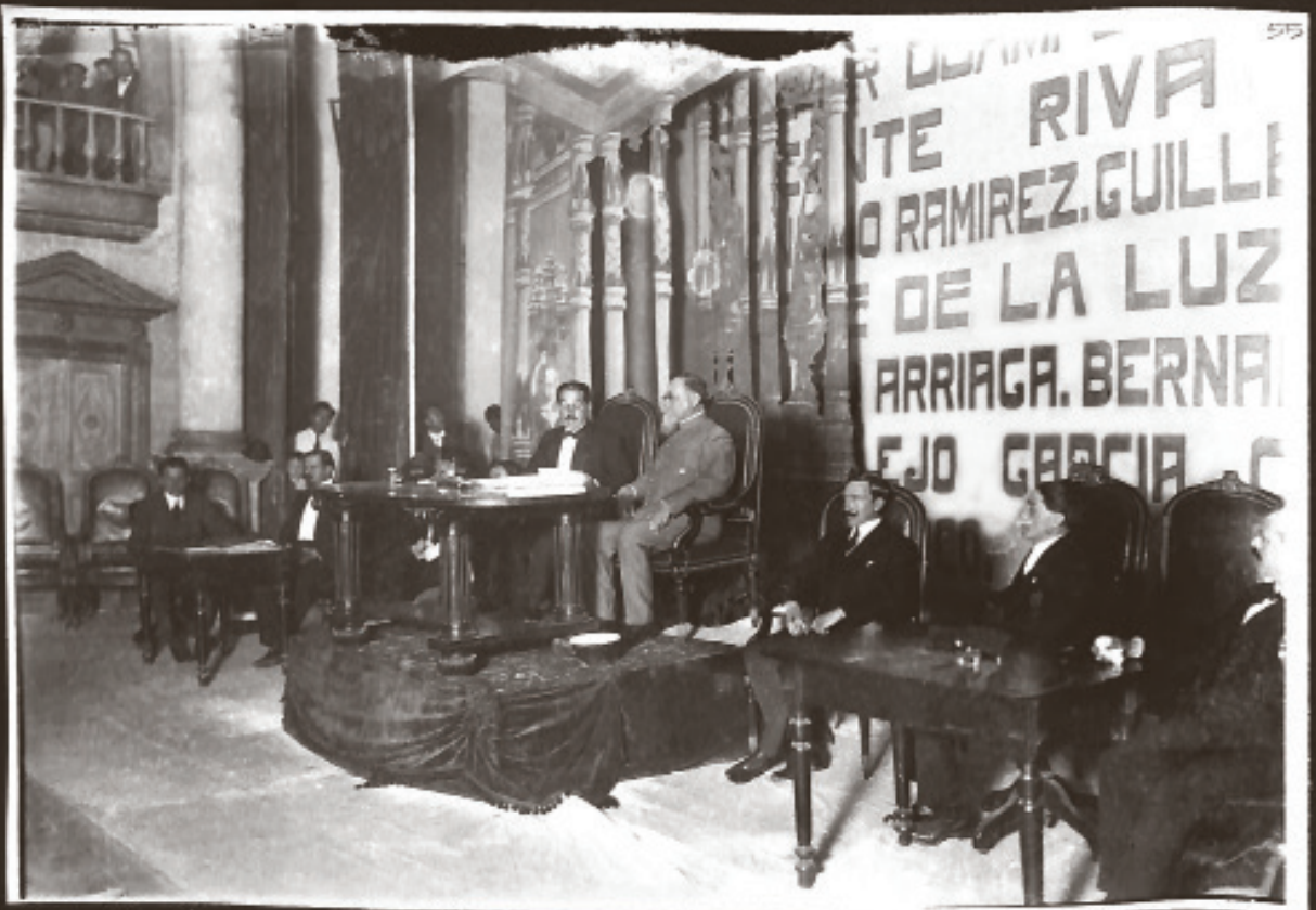
El Presidente del Congreso informa al 1º depe del feliz término de las labores del Congreso.